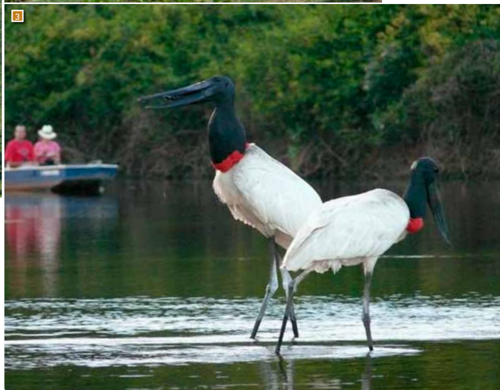
3 Reuzenooievaars zijn maar één van de zoveel verschillende diersoorten die je tegenkomt in de Pantanal.

heel droge, schrale savanne. Daarom groeien er hier bromelia's en cactussen tussen de wilde munt.