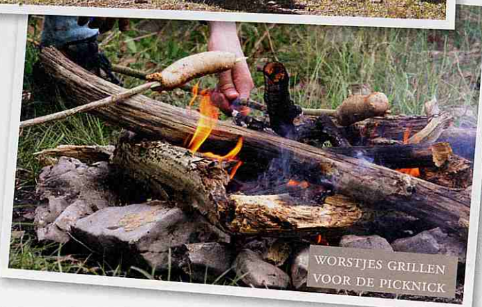
WORSTJES GRILLEN VOOR DE PICKNICK

Vlak bij huis wandelen we door de sprookjesachtige kaboutervallei en we zien twee edelherten. Die zijn heel uitzonderlijk, zelfs voor deze regio. De laatste paar honderd